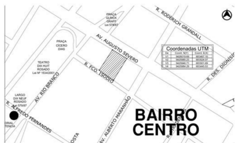
ANEXO ÚNICO POLIGONAL DE IMÓVEL LOCALIZADO NA AVENIDA AUGUSTO SEVERO