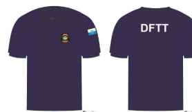
DESENHO MERAMENTE ILUSTRATIVO