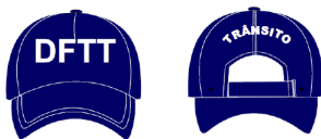
DESENHO MERAMENTE ILUSTRATIVO