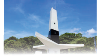
FAROL DO CABO BRANCO

João Pessoa, 05 de julho de 2024 * n° 0564 * Pág. 001/056