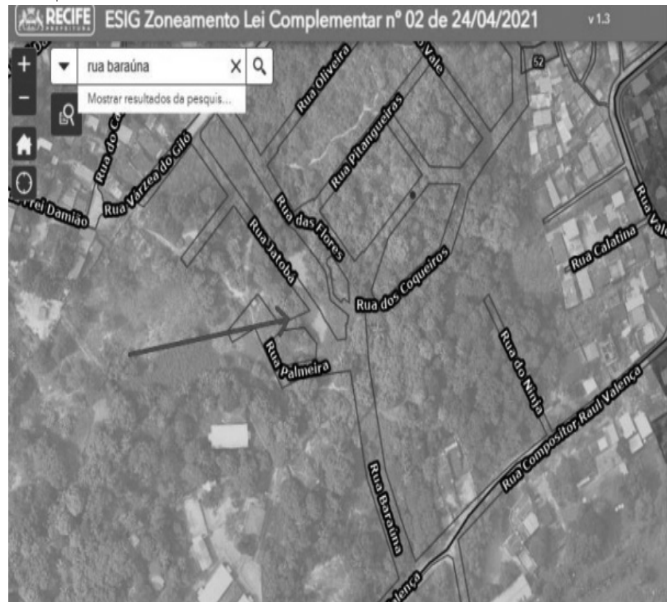
Figura 1 - Localização da praça delimitada pela Rua das Flores, pela Rua Baraúna e pela Rua Jatobá, no Bairro Dois Unidos, no município do Recife.