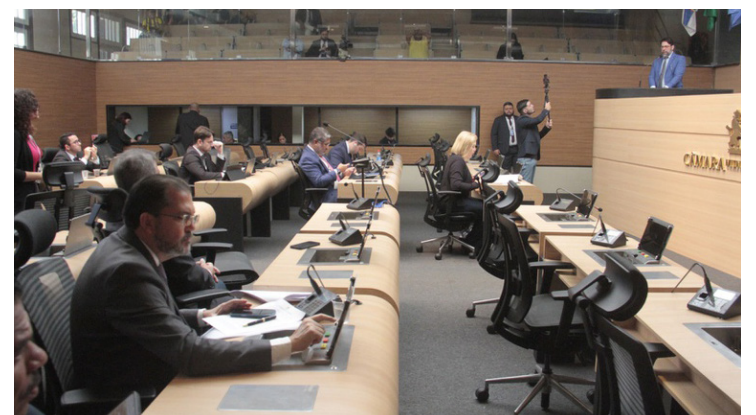
Discussão sobre cabine em parada de ônibus vira debate sobre qualidade do transporte

Grande Recife sob a liderança da governadora Raquel Lyra (PSD) e teceu críticas a gestões do Partido Socialista Brasileiro, afirmando haver pouco investimento municipal no transporte complementar do Recife. De acordo com ele, o Estado investirá na renovação da frota desse sistema. “É um transporte que conduz 70 mil pessoas por dia”.