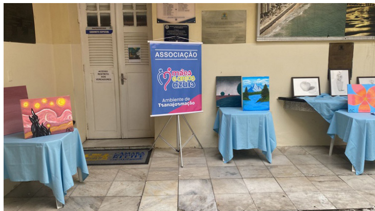
Câmara do Recife abrigou mostra com quadros pintados por adolescentes de 14 a 18 anos