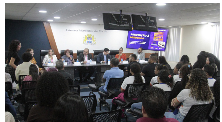
Audiência discutiu violência contra a mulher nas escolas

Comissões - No período de 27 de abril a 08 de maio, além das comissões permanentes da Casa citadas acima, também se reuniram outras, para deliberar sobre projetos em tramitação. Fizeram reuniões, as comissões de Educação, Cultura, Turismo e Esportes; da Mulher; de Finanças e Orçamento; de Acessibilidade e Mobilidade Urbana.