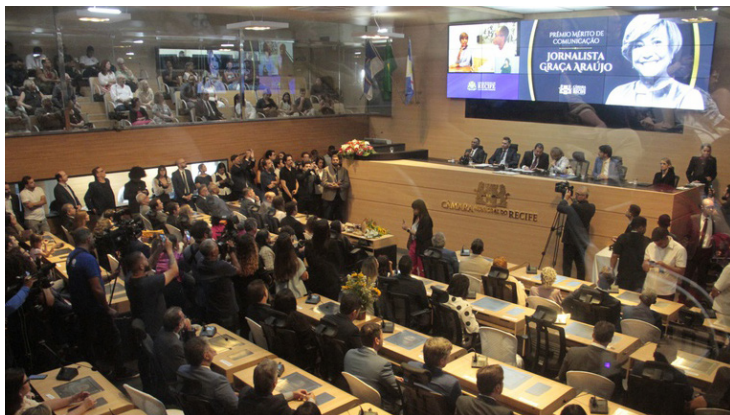
Câmara do Recife realizou solenidade para entrega do Prêmio Graça Araújo