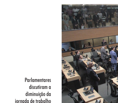
Parlamentares discutiram a diminuição da jornada de trabalho