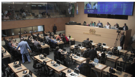
Vereadores debateram o assunto em plenário