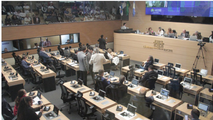
Câmara do Recife aprova projetos de lei do Executivo durante plenária nesta terça-feira

Precedido de intenso debate, que envolveu diversos parlamentares, o projeto de Lei do Executivo (PLE) número 6/2026, que visa instituir o Plano Municipal de Cultura do Recife para o decênio 2026-2036, foi aprovado em duas votações - uma durante reunião ordinária, e outra, extraordinária - pela Câmara Municipal, nesta terça-feira (2). O plano define conceitos, apresenta diagnósticos e aponta desafios para a gestão cultural no atual decênio. Ele foi aprovado no momento em que o País