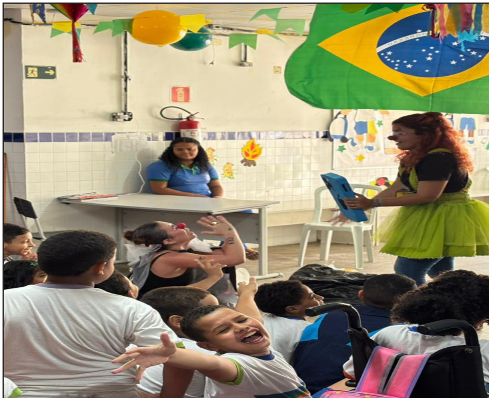
As ações abordaram temas como reciclagem, sustentabilidade, preservação ambiental e descarte adequado de resíduos

Atividades realizadas pela Emlurb e pelo Gabinete de Inovação Urbana envolveram estudantes e moradores dos bairros do Coque, Ibura e Vasco da Gama durante a Semana Mundial do Brincar 2026