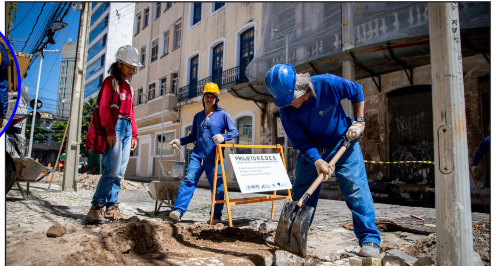
As atividades são coordenadas por meio do Gabinete do Centro do Recife (Recentro)

A Prefeitura está realizando um projeto bastante aguardado pelos recifenses: o embutimento da rede de telecomunicações no bairro do Recife, área central do município. A ação, coordenada por meio do Gabinete do Centro do Recife (Recentro), está dividida em duas etapas e é realizada em parceria com o Porto Digital. O valor total da obra é de R$ 2.097.098,73. O prefeito Victor Marques visitou a Rua do Apolo para conferir a execução dos serviços.