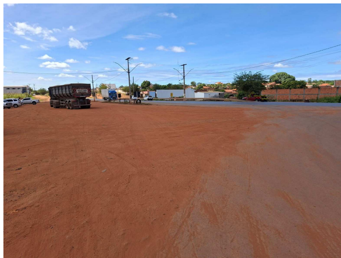
Imagem 02 – Vista do local

Travessa Major Claro, S/N – Centro – Cristópolis – Ba – Cep: 47.950-000