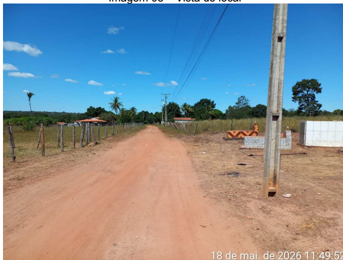
Imagem 09 – Vista do local