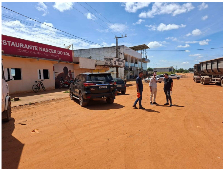
Imagem 06 – Vista do local

Travessa Major Claro, S/N – Centro – Cristópolis – Ba – Cep: 47.950-000