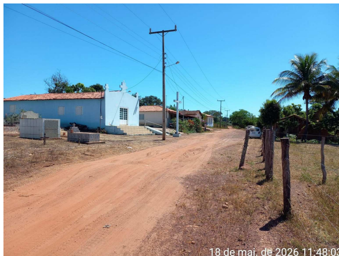
Imagem 08 – Vista do local

Travessa Major Claro, S/N – Centro – Cristópolis – Ba – Cep: 47.950-000