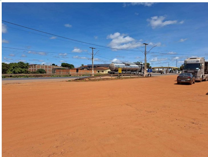
Imagem 04 – Vista do local

Travessa Major Claro, S/N – Centro – Cristópolis – Ba – Cep: 47.950-000