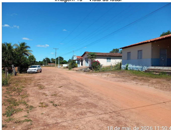
Imagem 10 – Vista do local