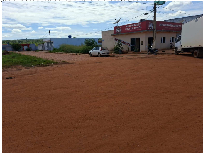
Imagem 01 – Vista do local

Segue o registro fotográfico anterior a execução das obras: