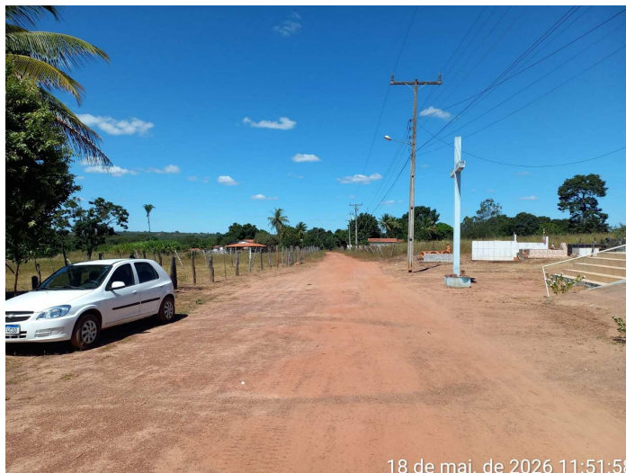
Imagem 12 – Vista do local

Travessa Major Claro, S/N – Centro – Cristópolis – Ba – Cep: 47.950-000