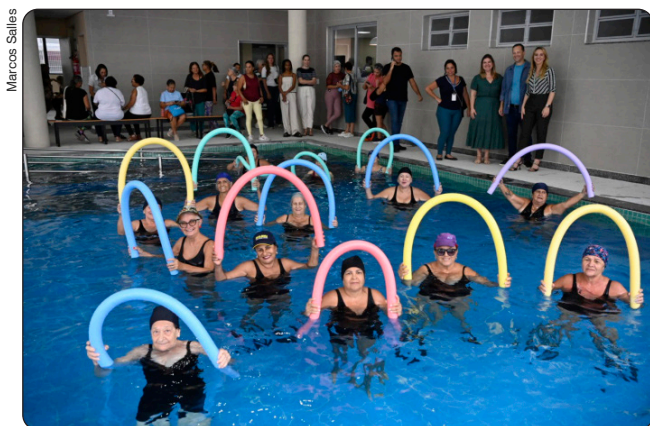
Início das atividades no Cemase de Jardim Camburi

Publicada em 04/05/2026, às 15h50 | Atualizada em 04/05/2026, às 16h31 Por Julia de Almeida (jalima@vitoria.es.gov.br), com edição de Andreza Lopes