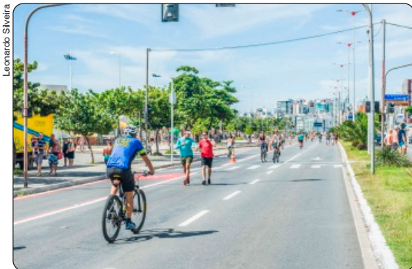
Rua de lazer na Avenida Dante Michelini, Praia de Camburi

Publicada em 04/05/2026, às 18h30 Por Julia de Almeida (jalima@vitoria.es.gov.br), com edição de Andreza Lopes