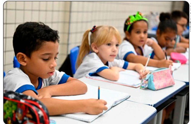
Vitória já ultrapassa as metas nacionais de alfabetização projetadas pelo MEC para os próximos anos