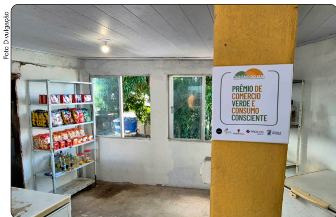
Placa "Prêmio de Comércio Verde e Consumo Consciente", instalada no interior do empreendimento no bairro Jaburu

Publicada em 06/05/2026, às 15h50 | Atualizada em 06/05/2026, às 15h59 Por Deyvison Longui (dlbatista@vitoria.es.gov.br), com edição de Andreza Lopes