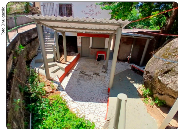
Bar do Carlão