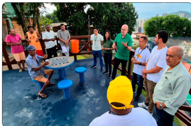
Entrega estabelecimentos revitalizados jaburu, prêmio comercio verde e consumo consciente

A placa "Prêmio de Comércio Verde e Consumo Consciente", instalada no interior do empreendimento, é mais do que uma identificação: ela marca a transformação de espaços e histórias nos bairros Jaburu e em São Benedito, em Vitória. Cada estabelecimento revitalizado passa a contribuir para um novo momento nas comunidades, fortalecendo a economia local, valorizando a cultura e oferecendo experiências mais acolhedoras para moradores e visitantes. A iniciativa faz parte do projeto Território do Bem, que une empreendedorismo, sustentabilidade e identidade territorial, mostrando que o desenvolvimento pode nascer de dentro para fora.