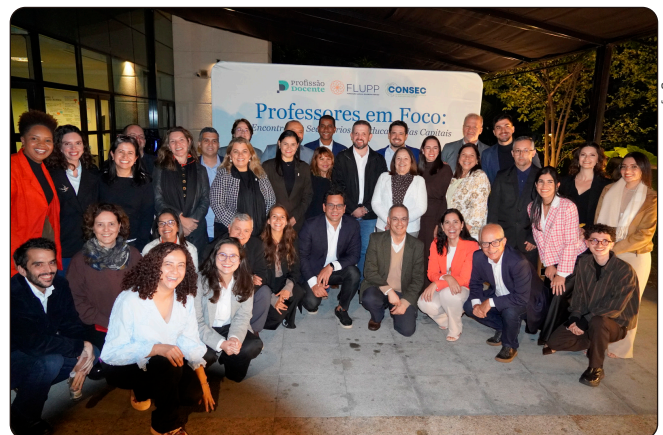
Educação de Vitória participa de encontro com lideranças educacionais de todo país

A capital capixaba esteve representada no "Professores em Foco: Encontro de Secretários das Capitais", promovido pelo Movimento Profissão Docente em parceria com o Conselho Nacional de Secretários de Educação das Capitais (Consec). Realizado em São Paulo, o evento reuniu representantes de 22 redes de educação das capitais brasileiras para debater políticas públicas voltadas à valorização e ao fortalecimento da carreira docente.