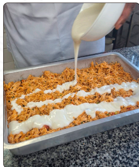
Torta de abóbora com frango e requeijão de inhame é finalista na 3ª edição do Concurso Melhores Receitas da Alimentação Escolar

Este documento foi assinado digitalmente por LUCIANO FORRECHI:02463362774