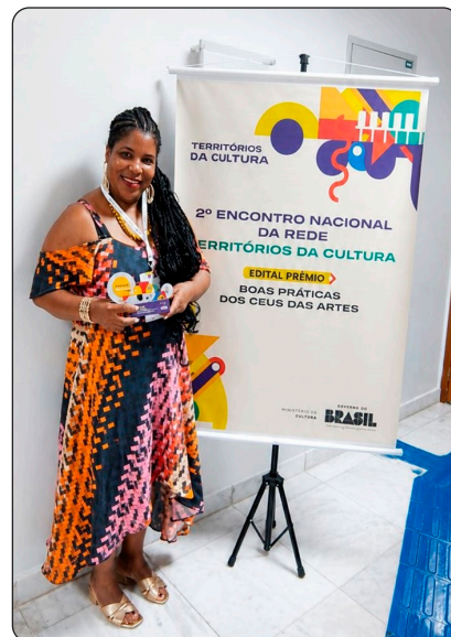
Jupiara representou o município de Vitória em Brasília

As oficinas acontecem de forma contínua no local e reúnem jovens, adultos e idosos da comunidade em atividades práticas que estimulam a autonomia e o fortalecimento da autoestima. Além das oficinas de costura, o espaço cultural promove diversas atividades voltadas à formação artística, convivência comunitária e fortalecimento social.