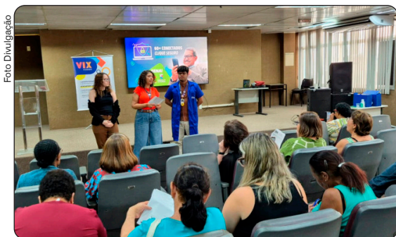
Edição anterior da oficina de segurança digital promovida pela PMV

Publicada em 21/05/2026, às 13h30 | Atualizada em 21/05/2026, às 13h33 Por Ana Clara Teixeira (acteixeira@vitoria.es.gov.br), com edição de Julia de Almeida