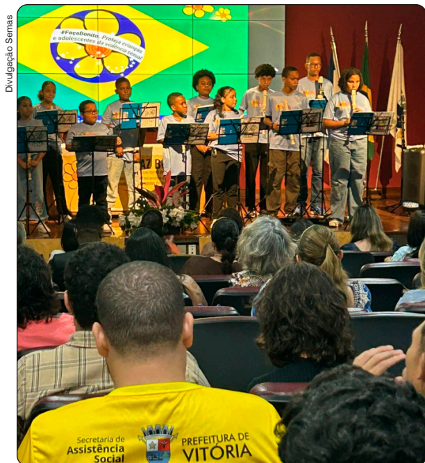
Grupo de flautas do Secri

Publicada em 27/05/2026, às 17h40 | Atualizada em 27/05/2026, às 17h41 Por Rosa Blackman (rosa.adriana@vitoria.es.gov.br), com edição de Julia de Almeida