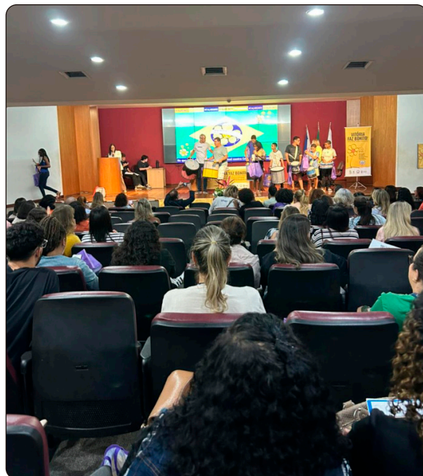
Grupo de música do Centro de Convivência Romão

O auditório Zemar Moreira Lima, localizado na sede da Prefeitura de Vitória, sediou o II Seminário Intersetorial de Enfrentamento da Violência contra Crianças e Adolescentes do município. Ao longo desta terça-feira (26), mais de 200 pessoas, entre trabalhadores e autoridades que atuam no Sistema de Garantia de Direitos (SGD), lotaram o espaço, reafirmando o compromisso coletivo com essa prioridade social.