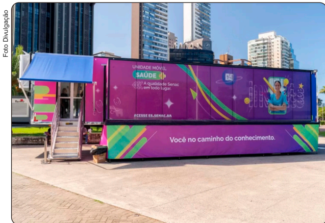
Unidade Móvel de Saúde do Senac-ES

Publicada em 28/05/2026, às 15h25 | Atualizada em 28/05/2026, às 15h26 Por Deyvison Longui (dlbatista@vitoria.es.gov.br), com edição de Julia de Almeida