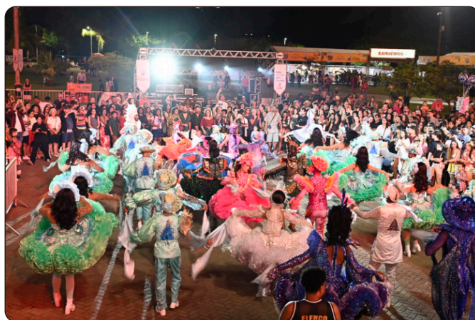
97ª edição da Festa de São Pedro

Informações: semc.gpdc@vitoria.es.gov.br | (27) 3132-2068.