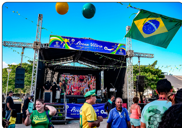
Em 2022, Vitória também recebeu telões para assistir o Brasil na Copa do Mundo