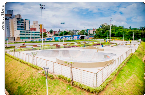
Pista de Skate do Atlântica Parque

Publicada em 16/06/2026, às 16h50 | Atualizada em 16/06/2026, às 16h50 Por Julya Feitosa (jfcavalho@vitoria.es.gov.br), com edição de Andreza Lopes