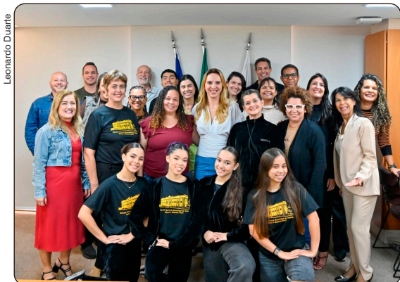
Alunas da Fafi participarão do Festival Internacional de Dança Goiás 2026

Publicada em 30/06/2026, às 21h25 Por Pedro Vargas (pedrovargas@vitoria.es.gov.br), com edição de Andreza Lopes