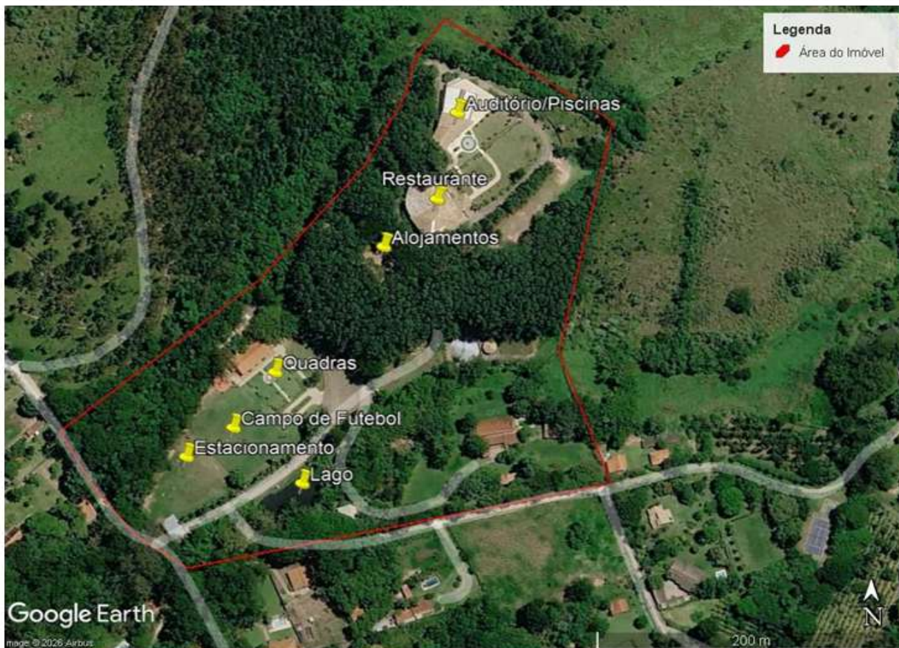
Fig. 04. Identificação das áreas do empreendimento baseada no croqui apresentado pela parte requerente. As áreas de quadra e alojamento não são identificadas na imagem mais recente de satélite, caracterizando potencial intervenção adicional no imóvel.