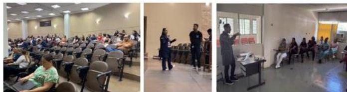
Ações de capacitação e alinhamento institucional com treinamentos práticos em laboratório para padronização das condutas assistenciais.