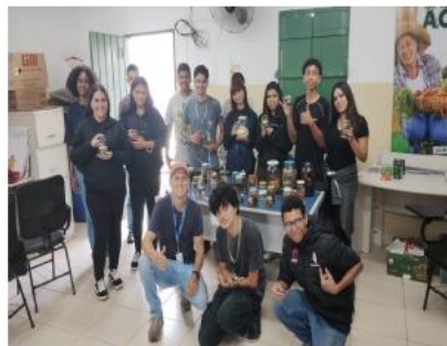
Palestra sobre animais peçonhentos realizada em 29/04/2026, aos alunos do Programa Jovem Empreendedor do Agro do Serviço Nacional de Aprendizagem Rural – SENAR-AR/SP.