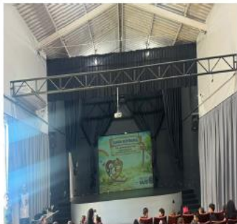
Palestra para prevenção de mordeduras - Colégio Prudente