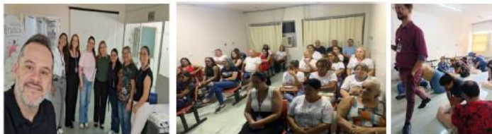
Ações de capacitação e alinhamento institucional com treinamento sobre PCR.

Treinamentos NEP (Núcleo de Educação Permanente) Janeiro e Fevereiro/26