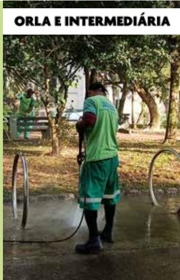
ORLA E INTERMEDIÁRIA

Abertura de berço na Avenida Campos Sales, na Vila Mathias