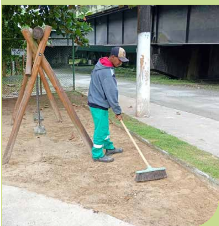
Serviço de limpeza e varrição na Praça Johanne Jensen, no Monte Cabrão