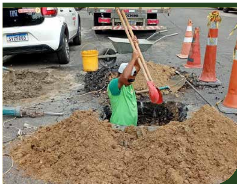
Manutenção asfáltica na Rua Vereador Henrique Soler, em frente ao número 288, na Ponta da Praia