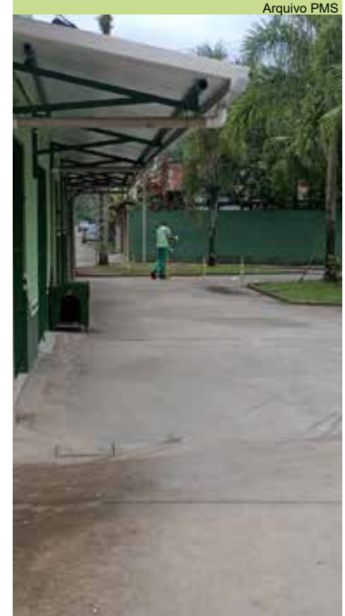
Limpeza na Praça Encarnación Alves Corpas, no Caruara