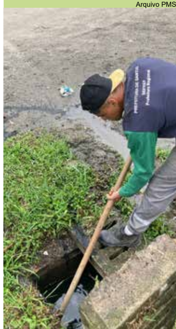
Limpeza de caixas de drenagem das ruas Particular C e D, no Caruara