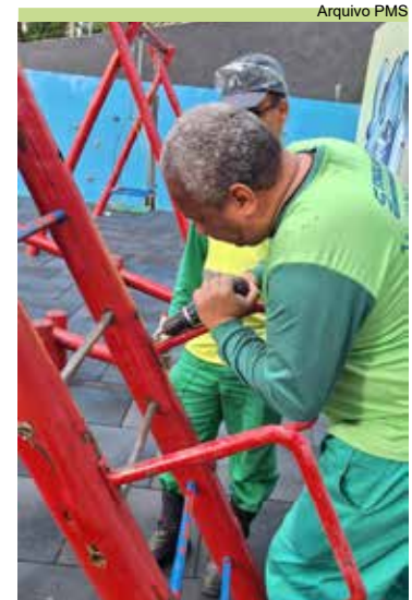
Conserto no escorregador do playground na Praça ver. Matsutaro Uehara, Tarô