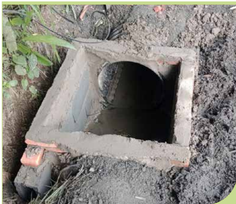
Produção de caixa de passagem na Rua Caramuru, no sentido Trav. Antônio Mineiro