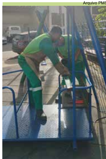
Reforma do alambrado do playground da Rua Raposo de Almeida