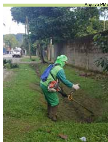
Serviço de roçada nas ruas São José, Santo Antônio e Xavantes