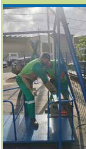
ORLA E INTERMEDIÁRIA

Limpeza de caixa na esquina das ruas 18 com Torquato Dias