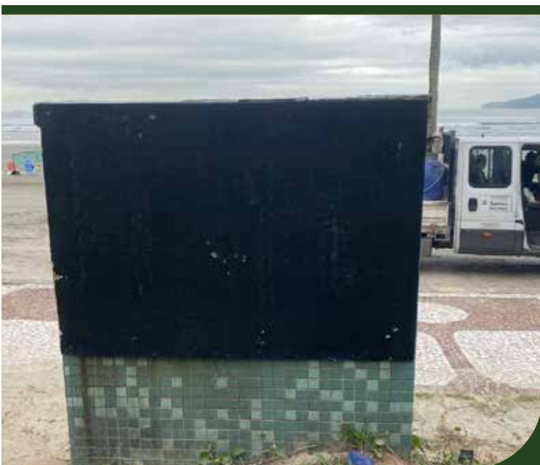
Instalação de tapume em caixa de luz, na orla do Canal 4

José Antônio Pimenta Bueno, o Marquês de São Vicente, foi um magistrado, diplomata e político brasileiro. Foi presidente do Conselho de Ministros, tendo chefiado o gabinete de 1870 e ocupado simultaneamente a Secretaria dos Negócios Estrangeiros. Escreveu importantes livros na área jurídica, tendo sido considerado uma referência para o estudo do direito constitucional no Brasil do século XIX