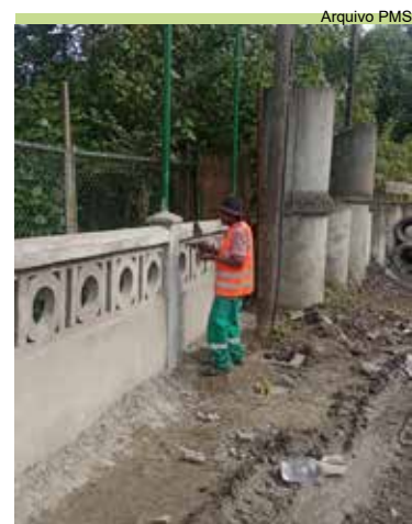
Finalização da construção da mureta da Coordenadoria Técnica