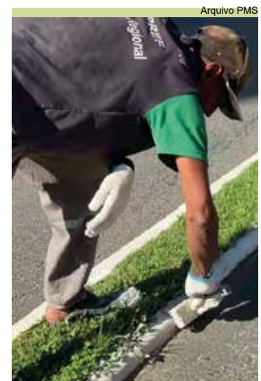
Encruzilhada: bairro ganhou pintura de guias