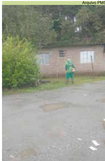
Monte Cabrão: zeladoria no Recanto Gaúcho e Morro da Mineira