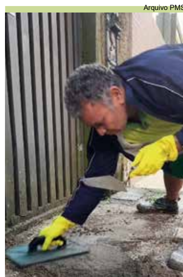
Realizado reparo de calçadas em diversas vias do Boqueirão