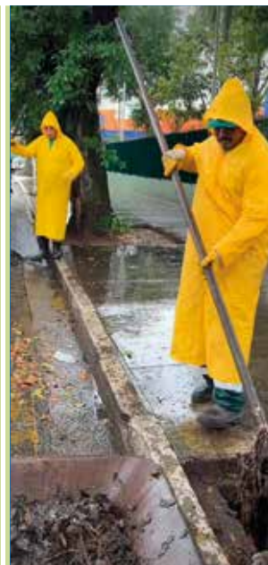
ORLA E INTERMEDIÁRIA

Zeladoria concluída na Praça Américo de Souza, no Morro São Bento