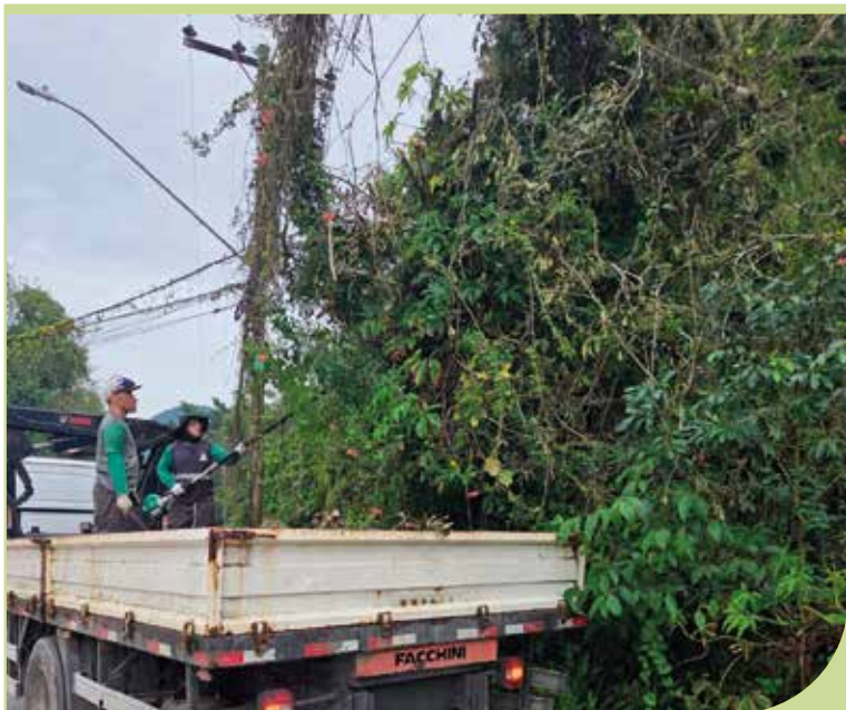
Poda de árvores percorreu rua Andrade Soares, no Caruara