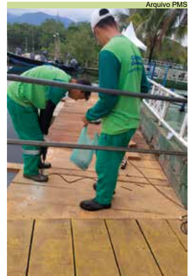
Concluída manutenção no deck de acesso à Ilha Diana