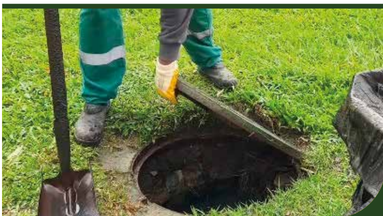
Ponta da Praia: jardim da orla teve manutenção no sistema de drenagem