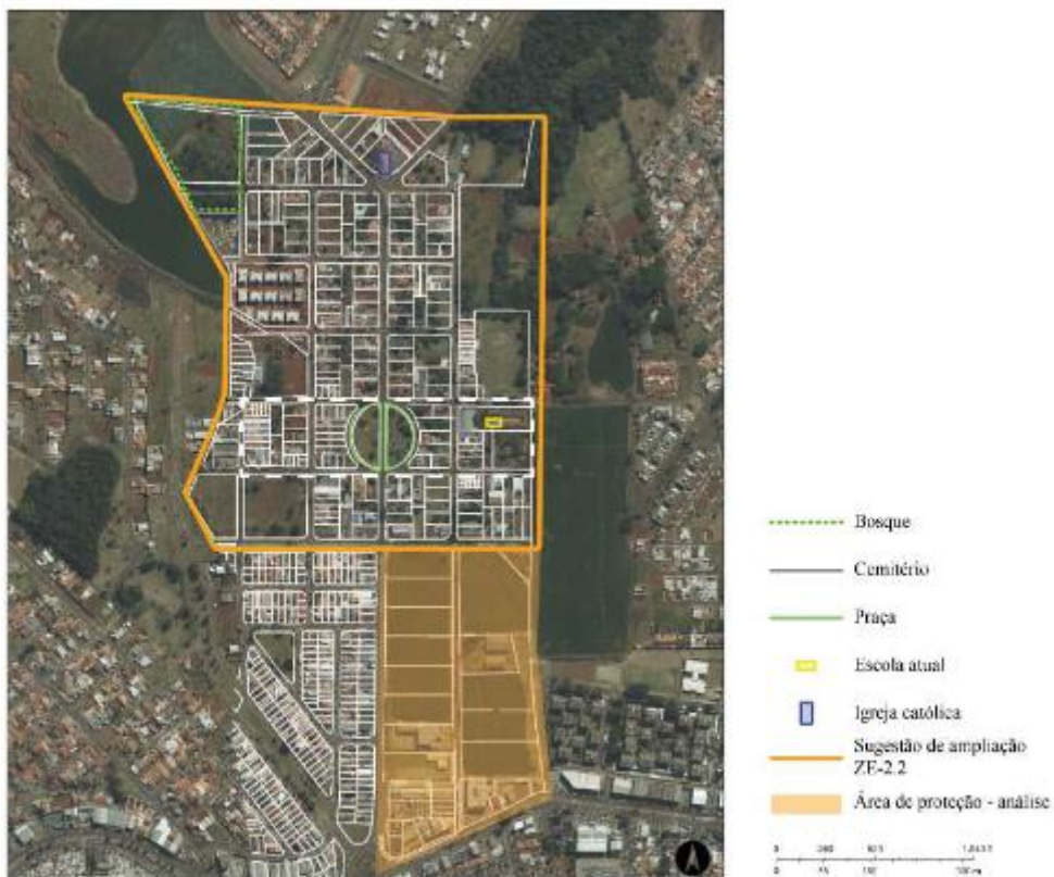
Figura 91 - Indicação de novo perímetro para a ZE-2.2