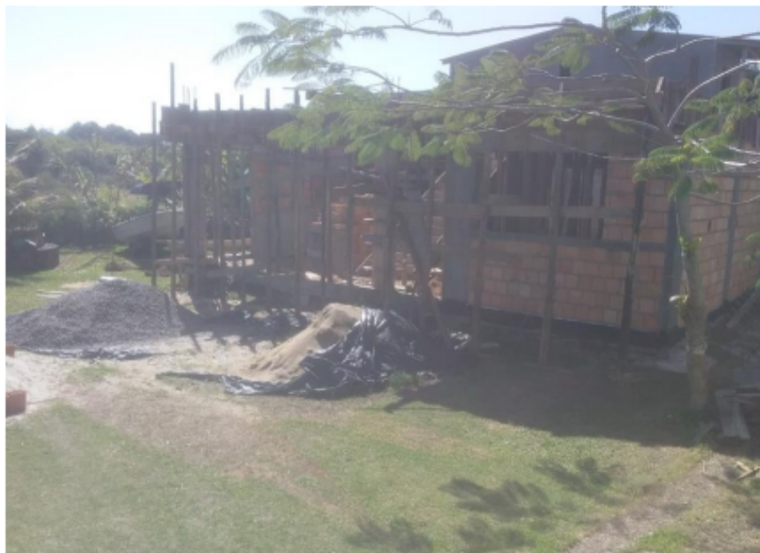
Figura 3 – Vistoria in loco .