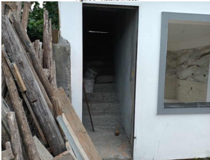
Figura 6 - Vistoria in loco.

DIRETORIA DE FISCALIZAÇÃO GERÊNCIA DE FISCALIZAÇÃO URBANÍSTICA DEPARTAMENTO DE FISCALIZAÇÃO URBANÍSTICA