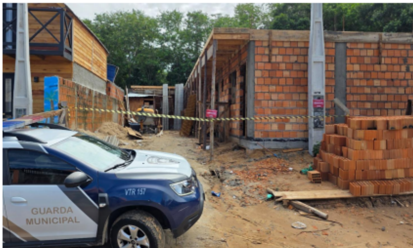
Imagem 1 – Foto da vistoria em 08/04/2026.

3.2 Os operários não se dispuseram a assinar o Auto de Embargo, alegando não terem vínculo com a proprietária e estarem há poucos dias trabalhando na obra. Desta forma, foi afixado adesivo de embargo em local visível, inclusive com isolamento da área por meio de demarcação com fita zebraada, conferindo publicidade ao ato fiscalizatório e identificando a obra como embargada a partir daquele momento, conforme imagens 01 e 02 abaixo.