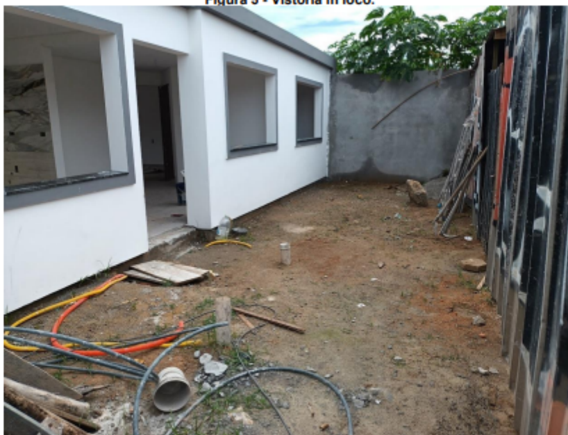
Figura 5 - Vistoria in loco.