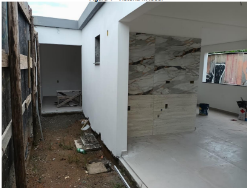
Figura 4 - Vistoria in loco.