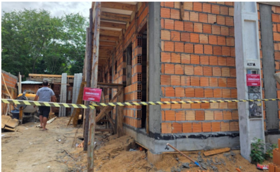
Imagem 2 – Foto da vistoria em 08/04/2026. Fonte: do autor.