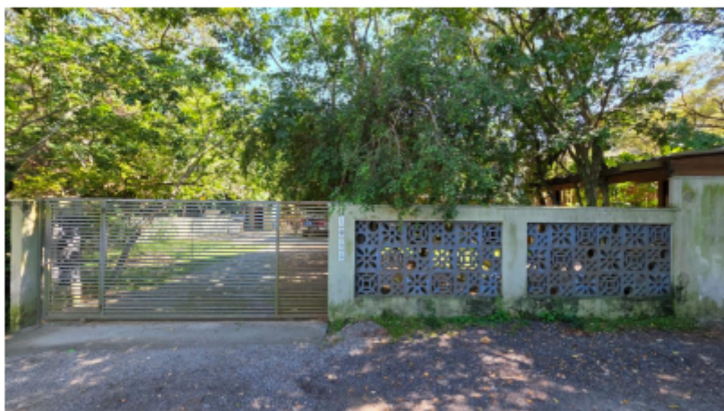
Imagem 3 – Foto da área 02 em 12/02/2025.

3.3 Na Imagem 02 acima está identificada a Área 01, correspondente a lote não edificado que, até o momento da vistoria, apresentava restos de obra depositados sobre o terreno e a existência de um barraco, sem que houvesse qualquer atividade ou pessoas trabalhando no local.