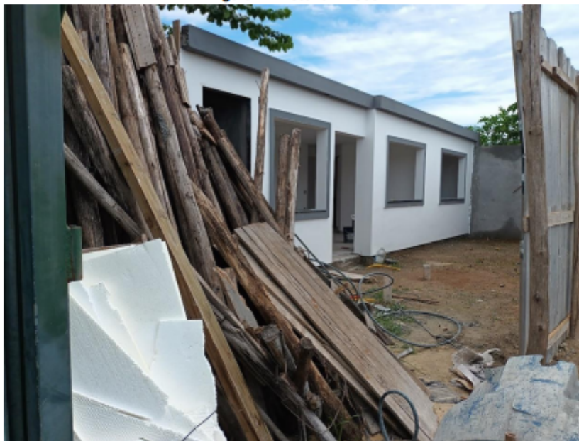
Figura 1 - Vistoria in loco.

Foram realizadas duas vistorias, porém não foi possível identificar o proprietário/responsável pela obra, que apresenta características residenciais. A edificação possui atualmente um pavimento único, mas há uma escada executada que dá acesso à laje superior, com claro indício de que se pretende acrescentar outro pavimento no futuro.