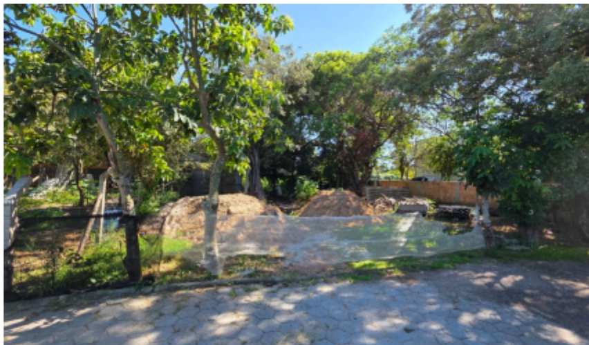
Imagem 2 – Foto da área 01 em 12/02/2025.

3.2 Na Imagem 01 acima, a linha pontilhada em vermelho indica, de forma aproximada, as áreas onde se localizam as edificações e os lotes situados em área sem cadastro imobiliário e sem identificação de proprietário legal. Para fins de referência e organização do registro, foi adotada a numeração apresentada, que acompanha as indicações das imagens abaixo.