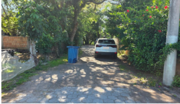
Imagem 8 – Foto do prolongamento da servidão, em 12/02/2025.

3.8 Na Imagem 8 acima está identificado o prolongamento da Servidão Ernesto Francisco Lucas, a qual, conforme o Geoprocessamento da PMF, tem seu término no ponto onde se encerra o calçamento em lajotas, havendo indícios de que tenha sido prolongada de forma irregular, de modo a viabilizar o acesso às áreas 01 a 05 já relatadas.