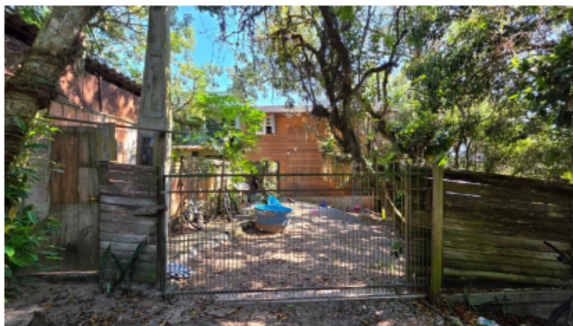
Imagem 5 – Foto da área 03 em 12/02/2025.

3.4 Nas imagens 3 e 4 acima está identificada a Área 02, correspondente a um dos lotes edificadas e habitados, sua frente está enumerada como 1055. A Imagem 4 evidencia a edificação visível a partir da via paralela localizada nos fundos do lote.