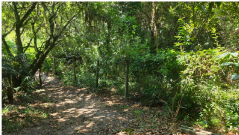
Imagem 7 – Foto da área 05 em 12/02/2025.

3.6 Na imagem 6 acima está identificada a Área 04, correspondente a um dos lotes edificadas e habitados, sua frente está enumerada como 1121.