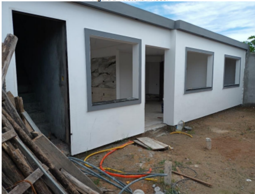
Figura 2 - Vistoria in loco.

DIRETORIA DE FISCALIZAÇÃO GERÊNCIA DE FISCALIZAÇÃO URBANÍSTICA DEPARTAMENTO DE FISCALIZAÇÃO URBANÍSTICA