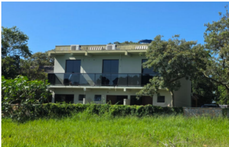
Imagem 4 – Foto da área 02 em 12/02/2025, vista a partir da rua dos fundos.

3.4 Nas imagens 3 e 4 acima está identificada a Área 02, correspondente a um dos lotes edificadas e habitados, sua frente está enumerada como 1055. A Imagem 4 evidencia a edificação visível a partir da via paralela localizada nos fundos do lote.