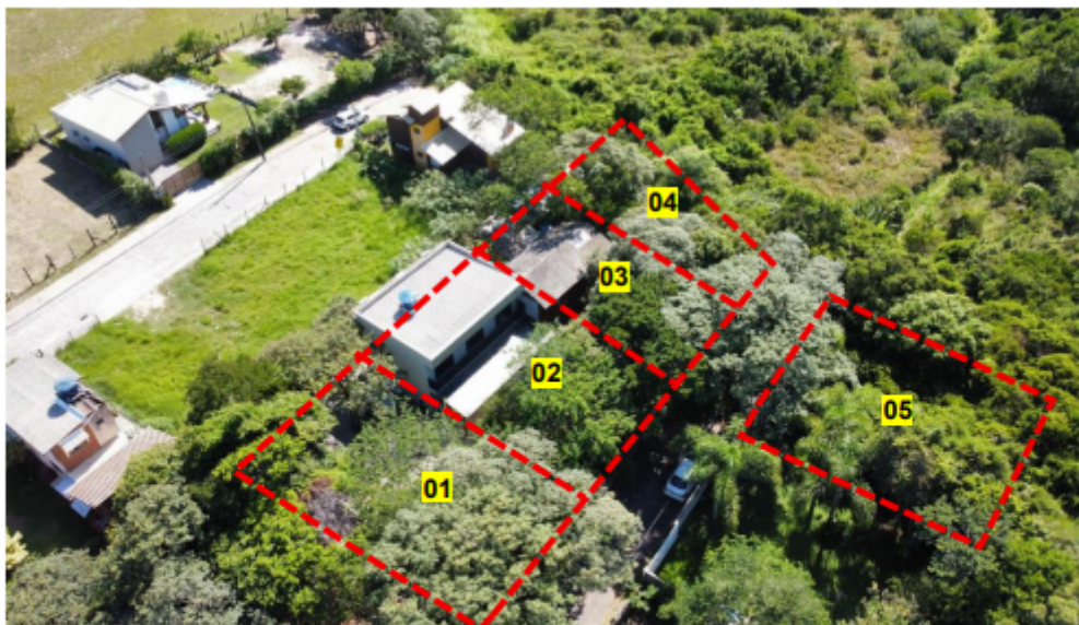
Imagem 1 – Foto da vistoria aérea em 12/02/2025.

3.1 Trata-se de apuração após denúncia recebida de possível parcelamento clandestino no final da Servidão Ernesto Francisco Lucas, no bairro São João do Rio Vermelho. Considerando a inexistência de inscrição imobiliária da área identificada na base de Geoprocessamento da PMF e o fato de que as edificações encontradas no local se apresentam concluídas e habitadas, em situação aparentemente consolidada com famílias residindo, não tendo sido constatadas obras em andamento nos demais lotes ali identificados sem inscrição imobiliária, o fiscal realizou inspeção expedita da área para fins de registro fotográfico e instrução do processo. As informações coletadas visam subsidiar a posterior convocação oficial dos eventuais proprietários, possuidores ou responsáveis legais, por meio de citação pública no Diário Oficial do Município, assegurando-se o devido processo legal para apresentação de defesa e análise da eventual possibilidade de regularização das edificações existentes. Ressalta-se que a ausência de inscrição imobiliária no sistema municipal de Geoprocessamento, por si só, não afasta a possibilidade de existência de escritura, posse ou outro direito legal sobre a área, motivo pelo qual se faz necessária a continuidade da apuração.