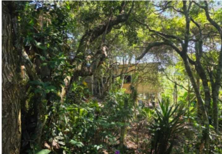
Imagem 6 – Foto da área 04 em 12/02/2025.

3.6 Na imagem 6 acima está identificada a Área 04, correspondente a um dos lotes edificadas e habitados, sua frente está enumerada como 1121.