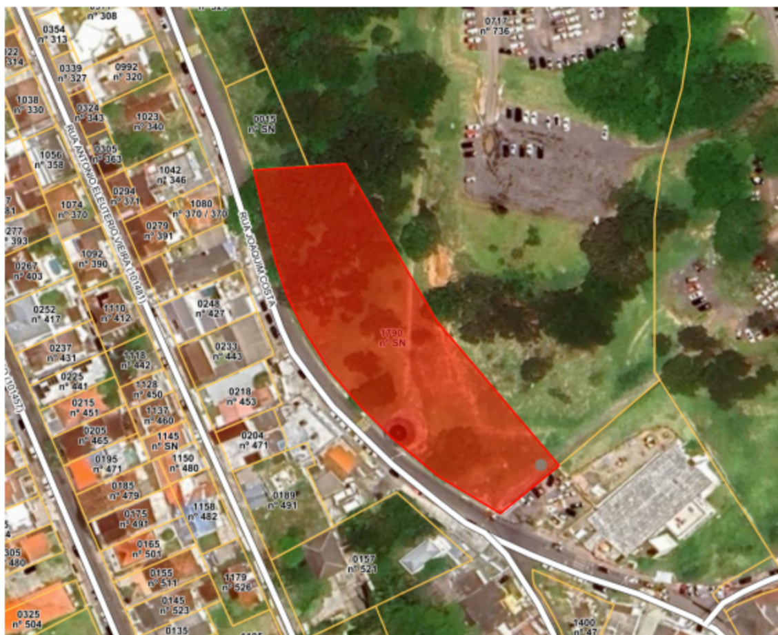
Figura 1 - Área da Matrícula

Rua Conselheiro Mafra, 656, 4º andar, Centro, Florianópolis/SC