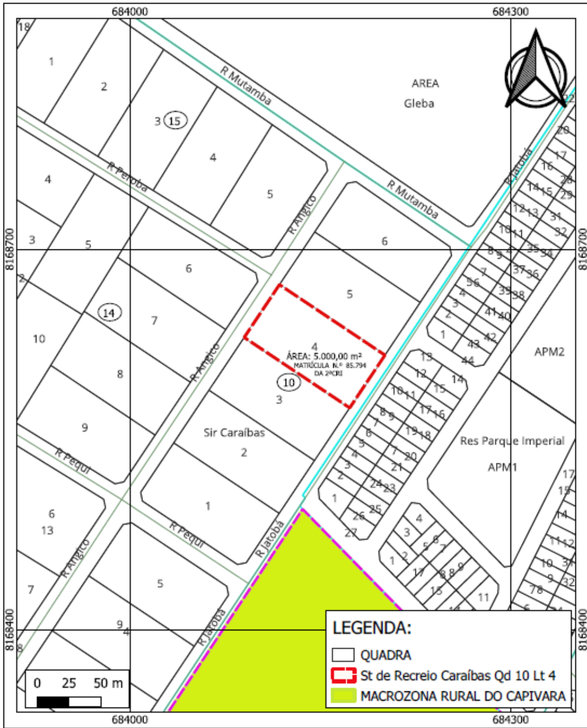
Recorte Do Sistema De Informações Geográfica De Goiânia – SIGGO.